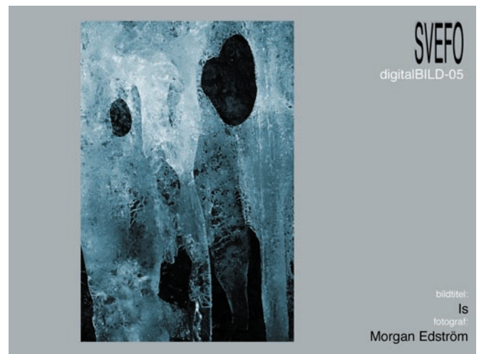
Porträttbild, höjd max 700 pixlar