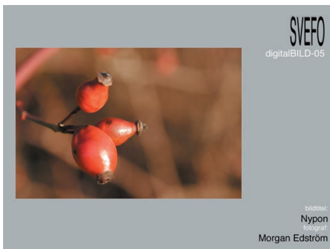
Landskapsbild, bredd max 700 pixlar